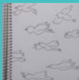
Tintas del día 30 de mayo