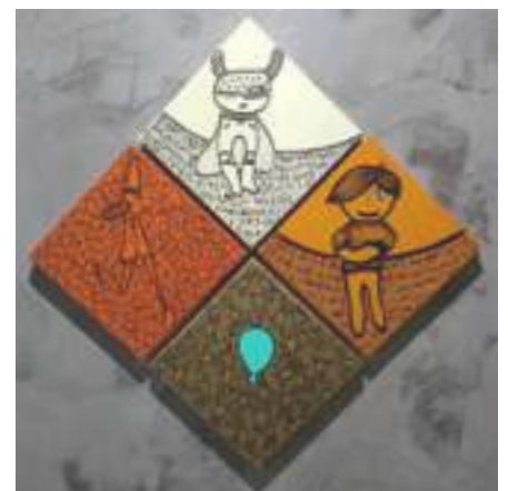
“Otto y su vida luminosa”

La obra “Otto y su vida luminosa” colabora con la reflexión en torno a pensar desde y en distintas dimensiones y formatos, cómo confluyen en el marco de una propuesta educativa, y la medida en que ser versátiles y flexibles nos permite transitar de otro modo la experiencia educativa.