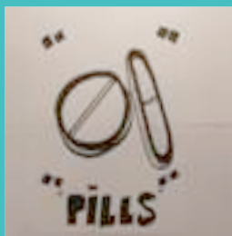
Tintas del día 29 de mayo