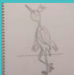
Tintas del día 30 de mayo